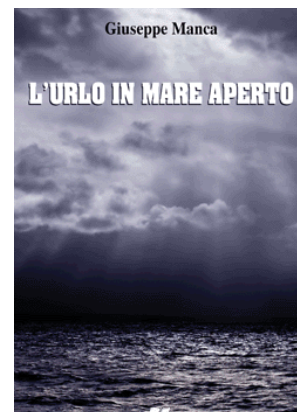
La copertina del libro "L'urlo in mare aperto"

Se mi presentano un foglio bianco, io entro in panico. Come quando comincio un quadro: entro in panico, devo stare un attimo, credo una decina di minuti, a guardare il foglio; quindi poi faccio altro, guardo il foglio, perché non riesco veramente a entrare nel foglio bianco. Invece in due secondi entro nel foglio nero. Riesco a vedere tutto e di più. Nel buio io riesco assolutamente a vedere di tutto. Se io potessi scrivere anche al buio, sarei