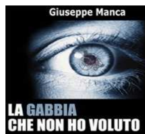
La copertina del libro "La gabbia che non ho voluto"