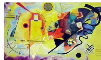
Vasilij Kandinskij: Giallo, rosso, blu

Anche per Paul Klee l'essenza della musica rappresenta la condizione di immaterialità e astrazione a cui aspirare, attribuendo ad essa uno statuto di superiorità che lo ha portato ad un superamento dei parametri dell'estetica tradizionale del tempo. Dimostrando ancora una volta come la musica da molti secoli sia l'arte che non ha adoperato i propri mezzi per ritrarre la natura ma bensì per descrivere la vita psichica dell'artista, per creare una propria vita peculiare fatta di suoni.